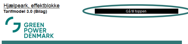
Figur A6: Navigation til toppen af arket

Figur A7 illustrerer de andre navigationsmuligheder: